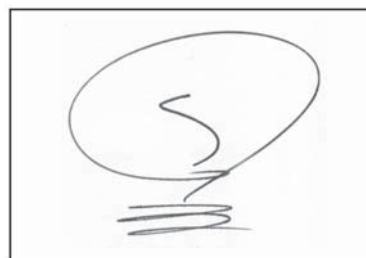
(۹-۴) نمونه امضای وکیل شخص حقوقی